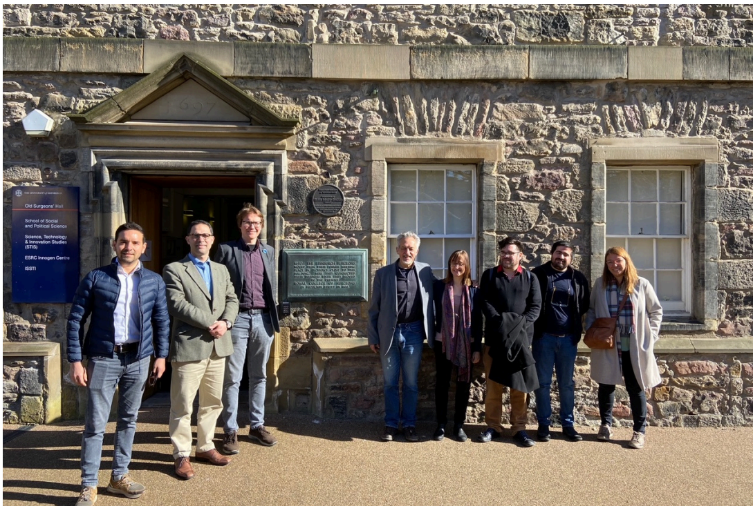
Comitiva EE.UU. en University of California - Davis

Durante abril y mayo dos comitivas compuestas por académicos y académicas de la Universidad de Santiago de Chile (Usach) y la Universidad Católica del Norte (UCN) se embarcaron en una gira por Europa en la que visitaron diferentes universidades de prestigio internacional para conocer más acerca de sus buenas prácticas y políticas internas, en España y Reino Unido.