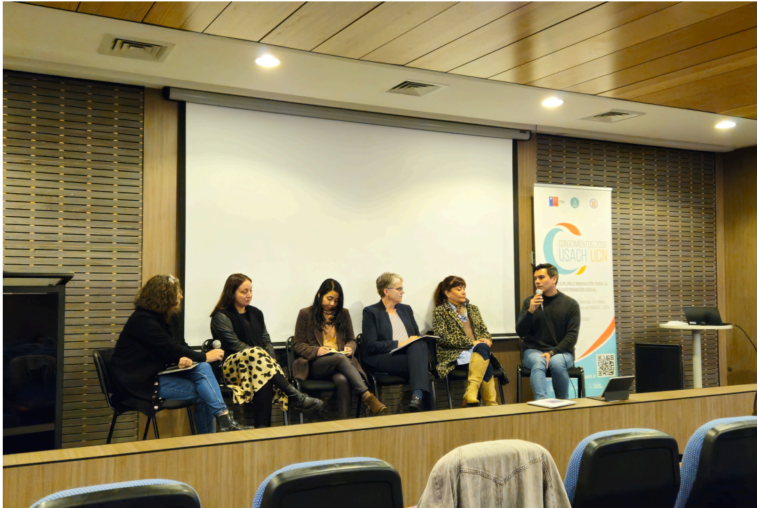
Espacio de conversación del foro.

El pasado martes 7 de mayo se realizó el Foro «Avances y Desafíos de las Políticas de Género en la Educación Superior» que invitó a la comunidad universitaria a reflexionar sobre las orientaciones y estrategias universitarias que han contribuido a la equidad de género en la academia, destacando experiencias exitosas, lecciones aprendidas y desafíos o propuestas aún en desarrollo.